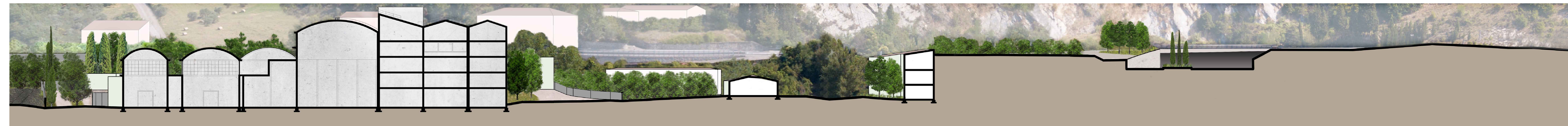
Sezione BB - Stato di fatto | Scala 1:500