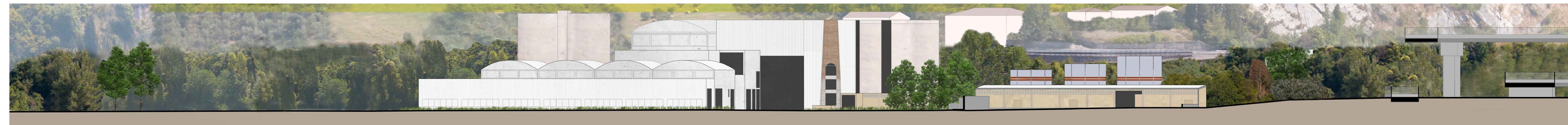
Sezione AA - Stato di fatto | Scala 1:500