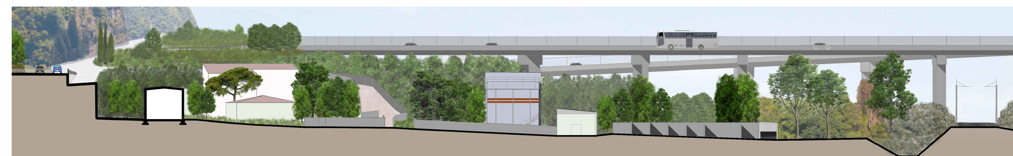
Sezione CC - Stato di fatto | Scala 1:500