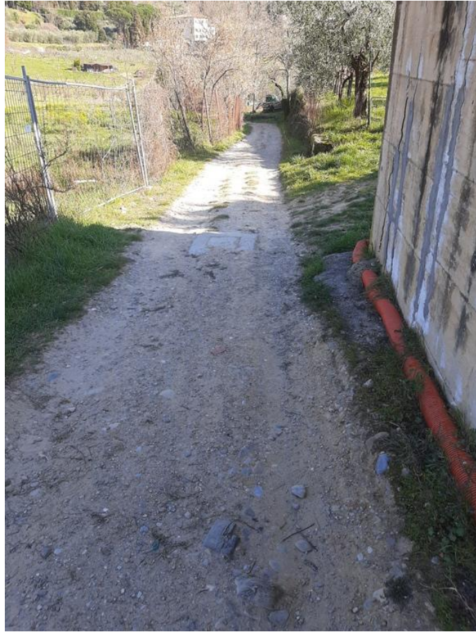
20 – Strada poderale 3