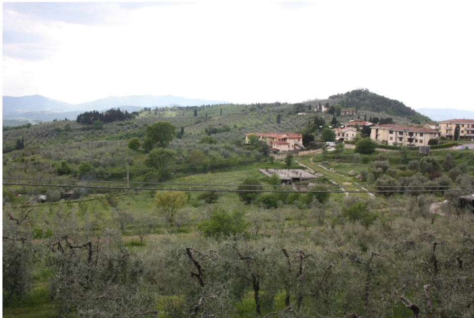
29 –Panoramica da est verso ovest