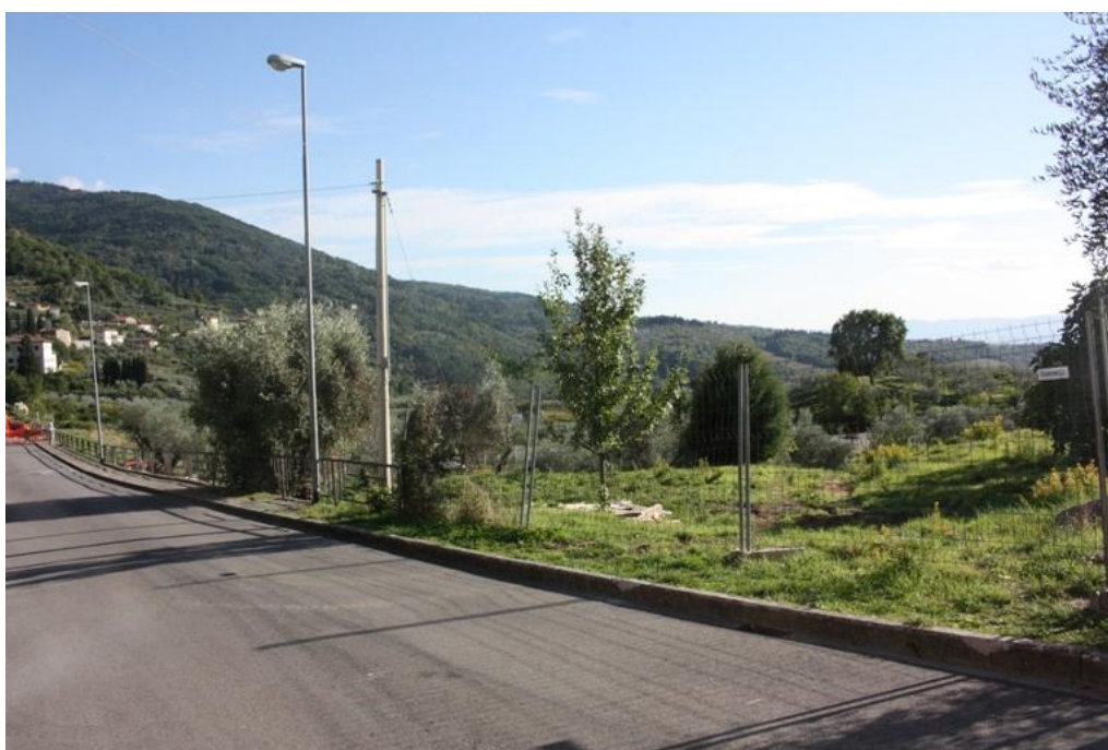
24 – Ingresso parcheggio nord ovest da via dello Stradone