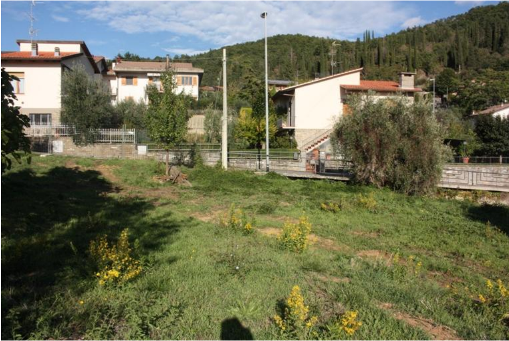
27 – area parcheggio Nord-2