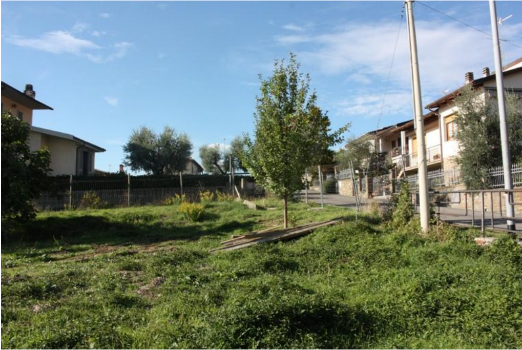
14 – Vista area Nord