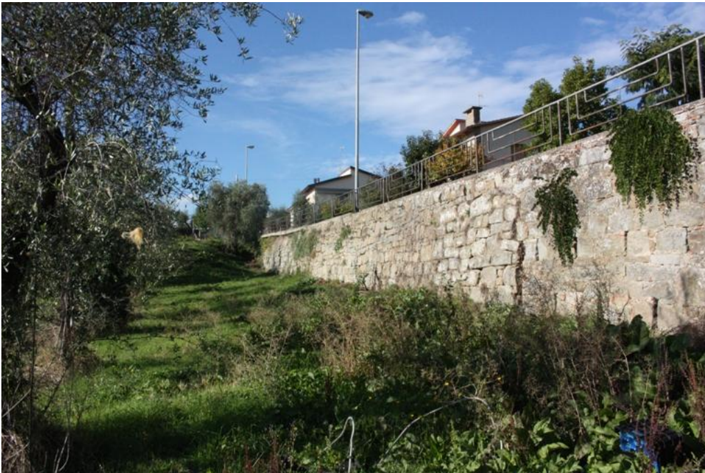
15 – Muro contenimento Via dello Stradone