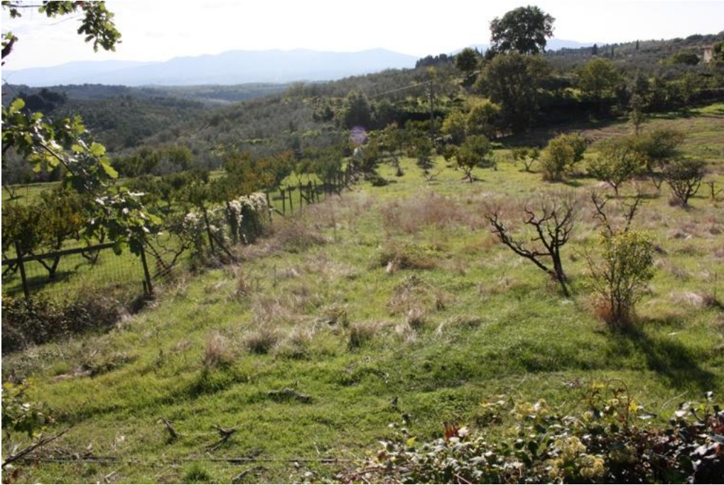
04 – vista sud ovest Verde Pubblico