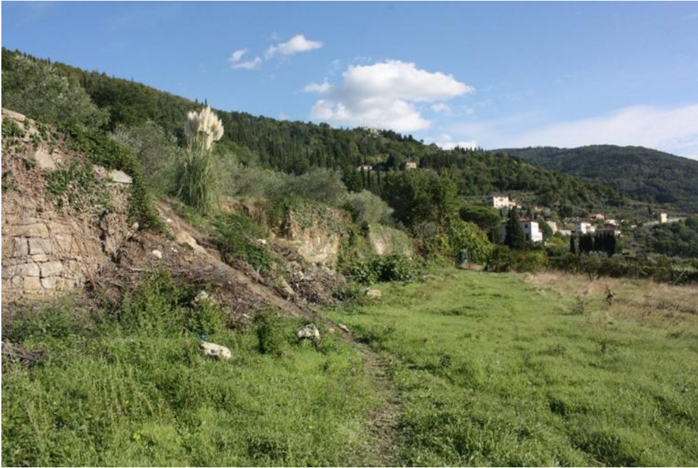
06 –Muro contenimento da ripristinare