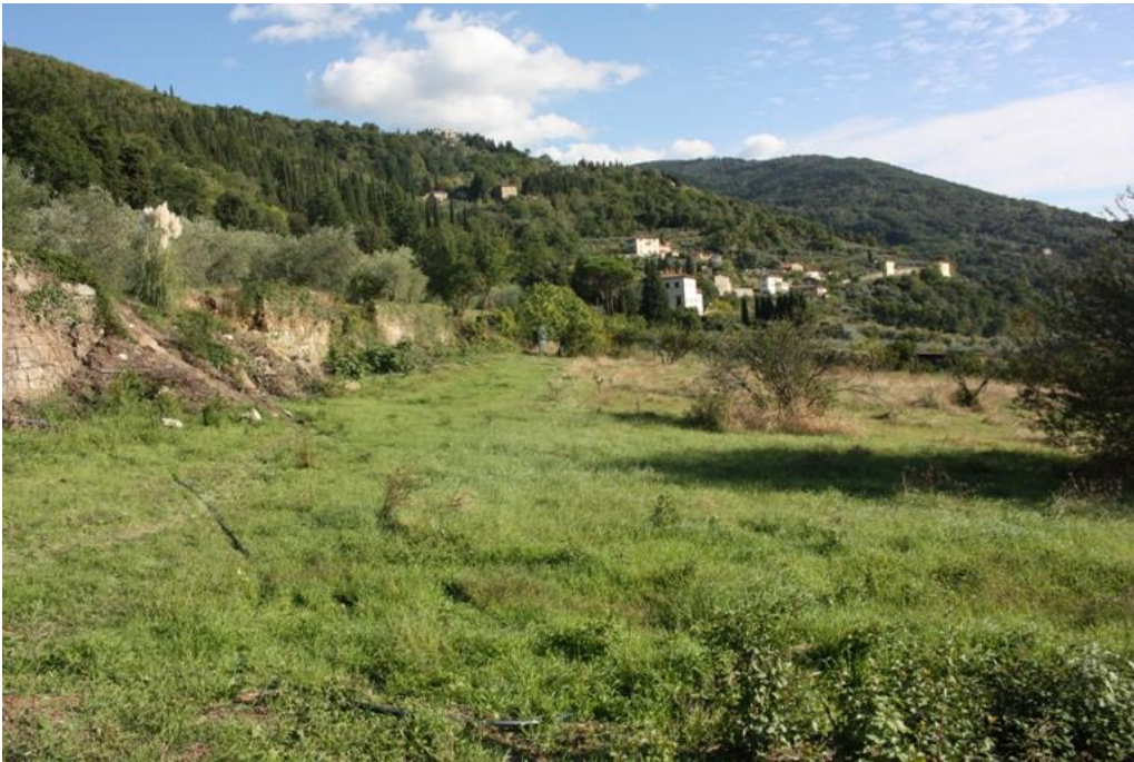
07 – Panoramica verso est