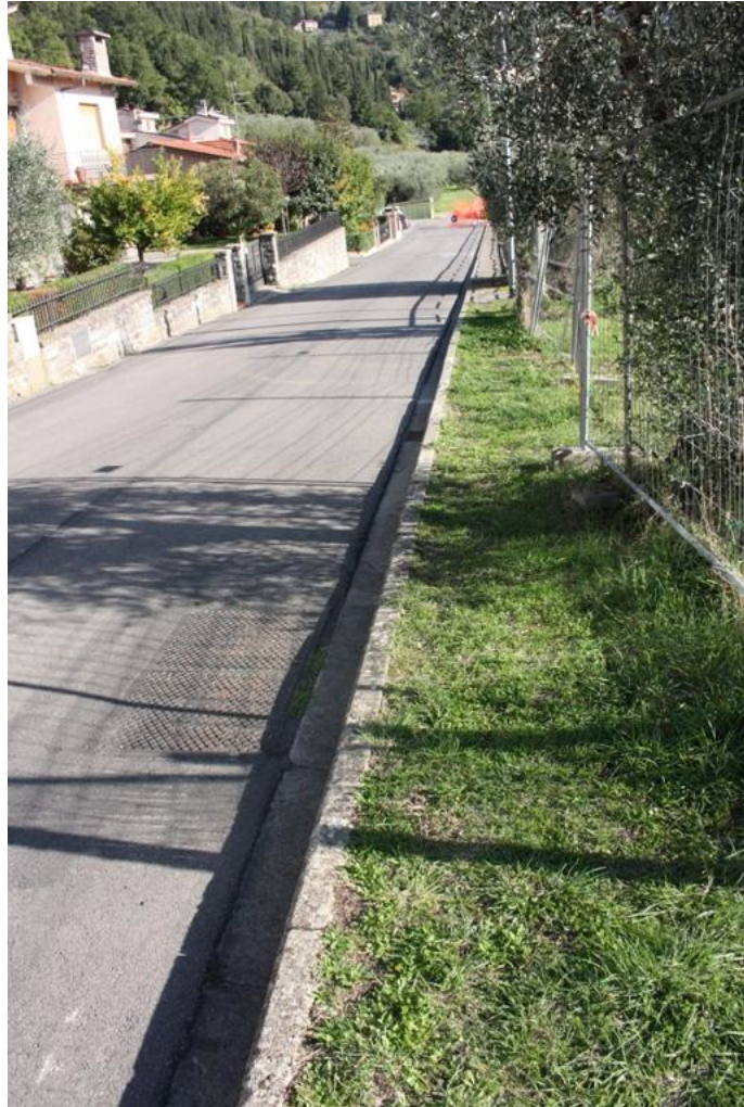
25 – Marciapiede da pavimentare Via dello Stradone