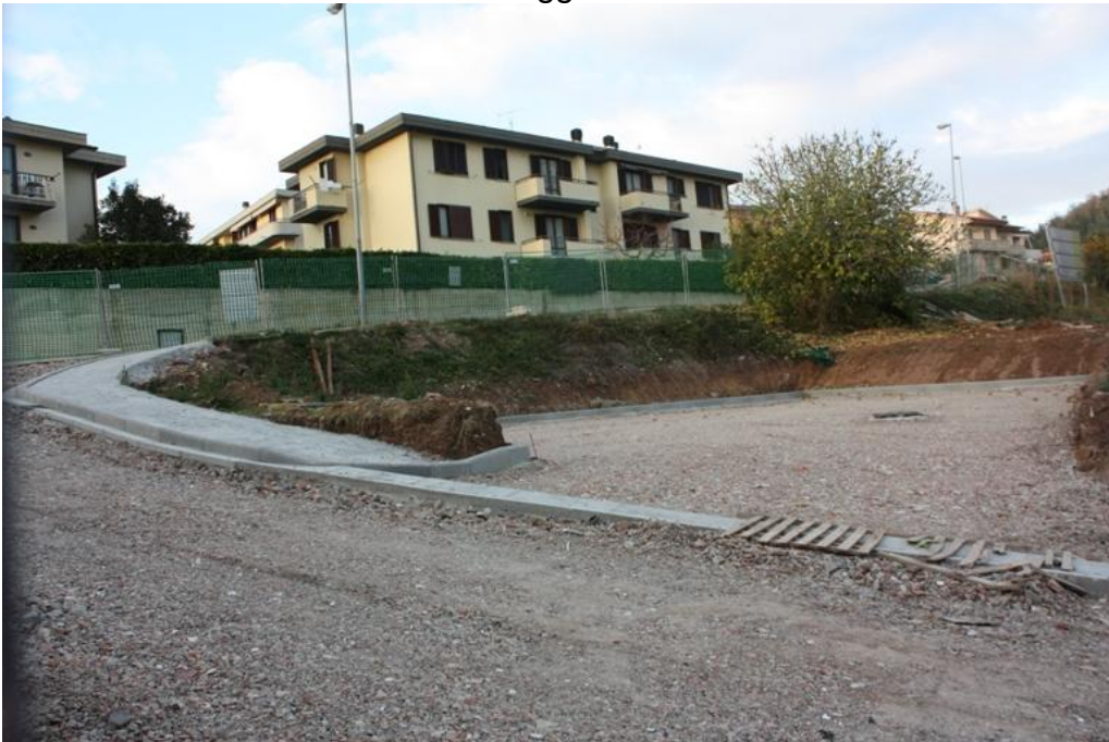
11 – parcheggio Ovest 2012