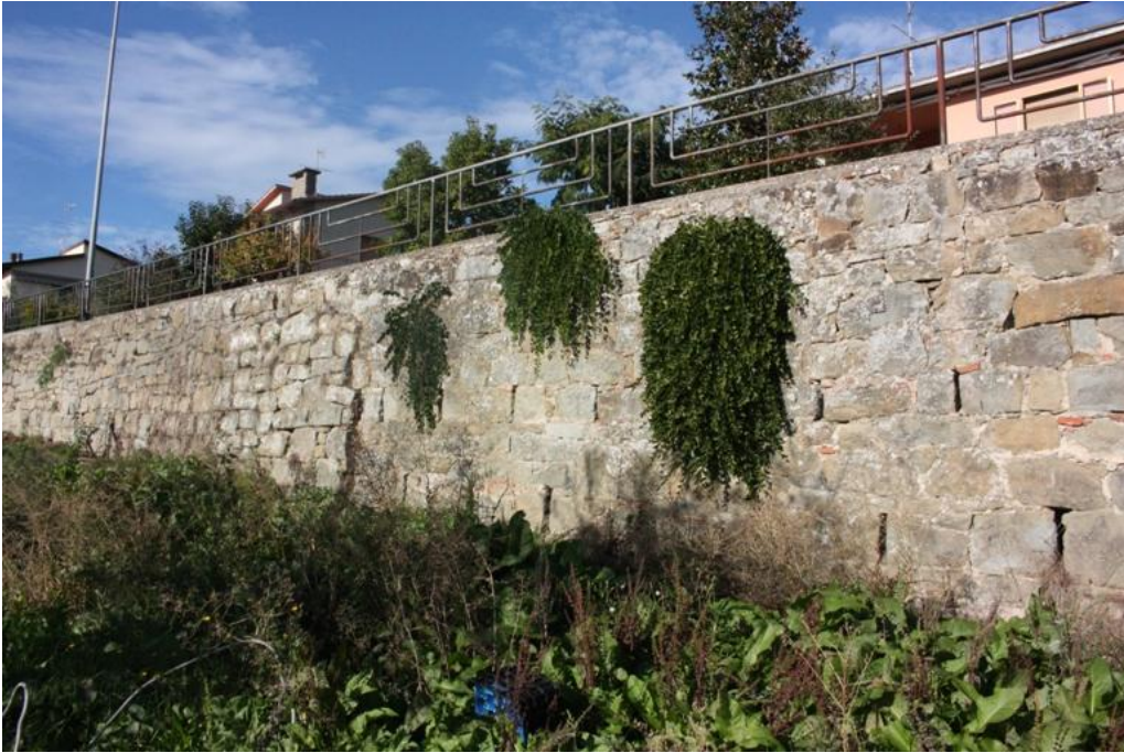
16 – Muro contenimento Via dello Stradone 2