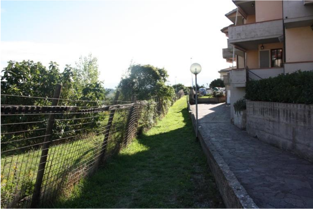
21 – Camminamento pedonale1