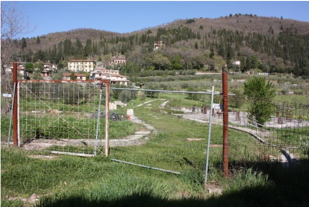
09 – strada di lottizzazione 2022