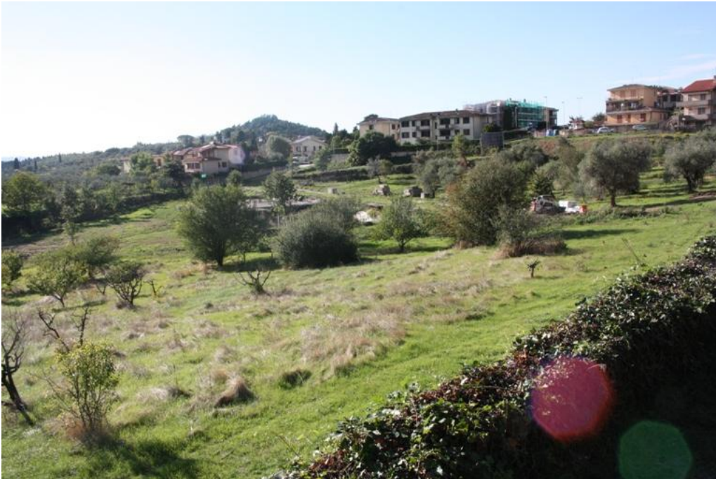
05 – Panoramica verso ovest