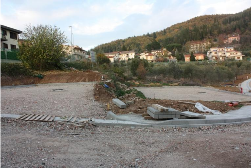
10 – Parcheggio ovest 2012