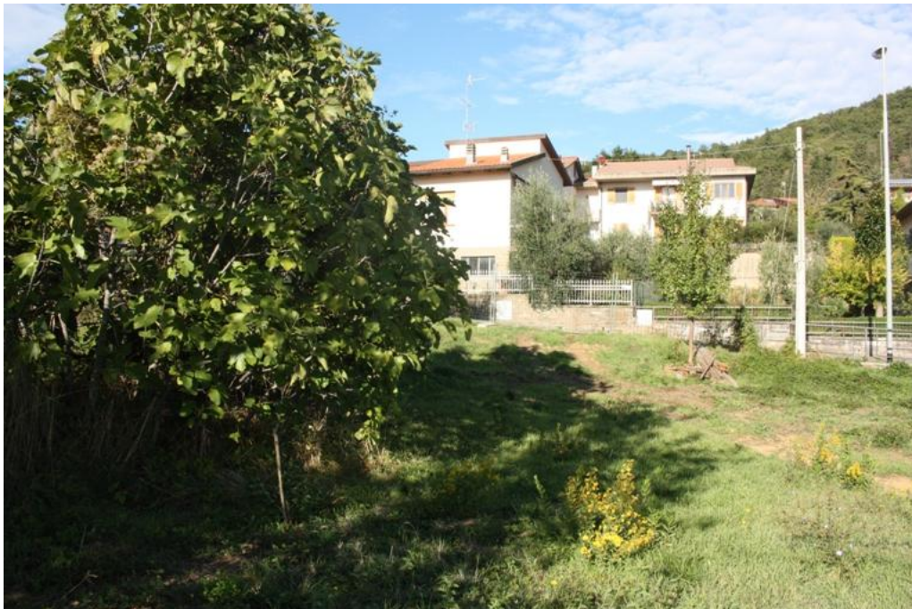
26 – Area parcheggio nord-