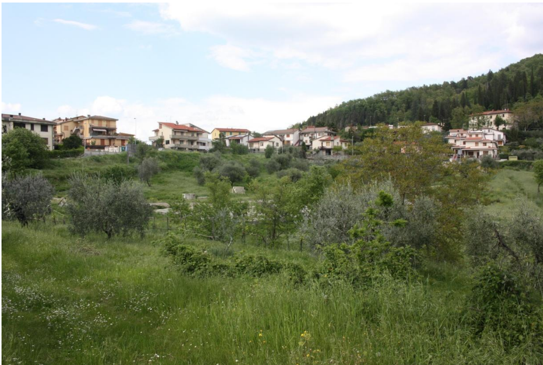
30 –Panoramica da ovest verso nord-est