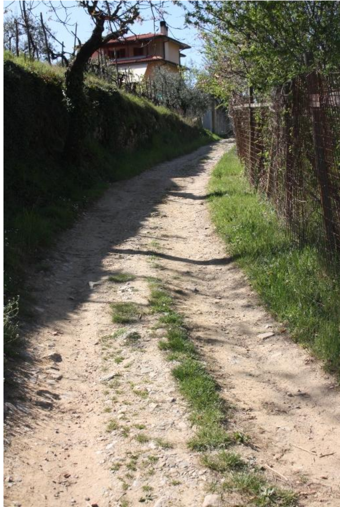
19 – strada poderale 2