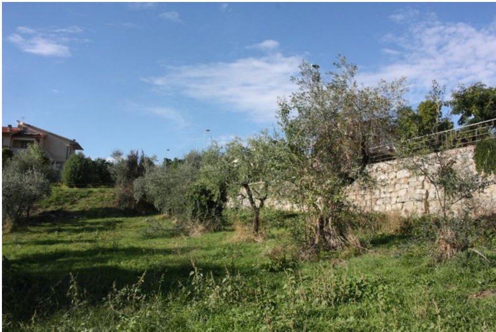
03 – vista sul muro di via dello Stradone