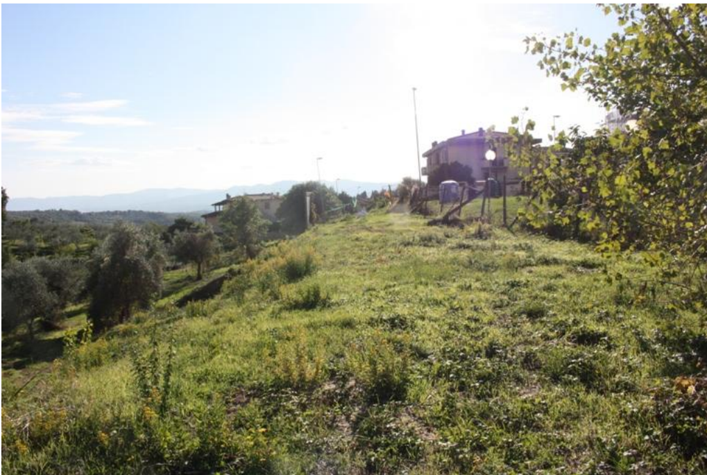
13 – vista area parcheggio Nord-