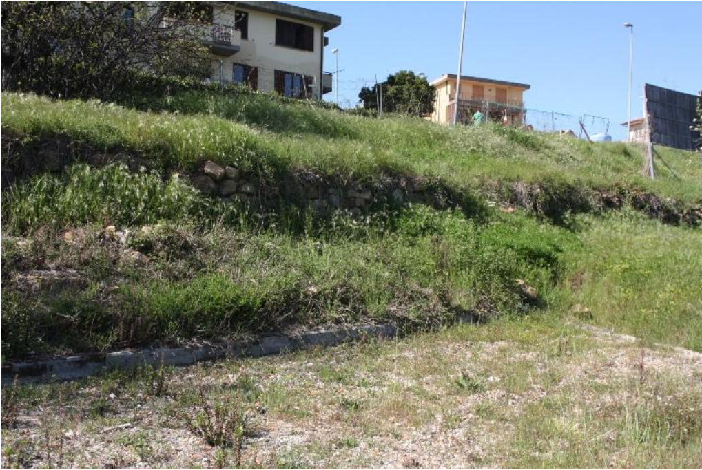
12 – parcheggio ovest 2022