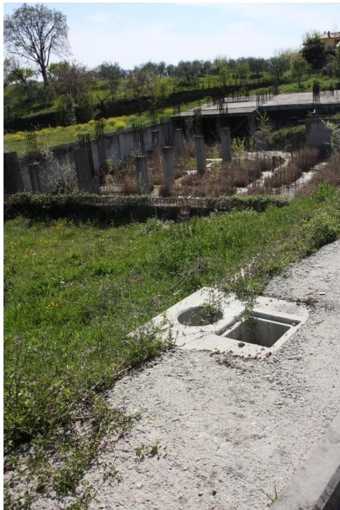
28 – Edificio in costruzione nel lotto n°4