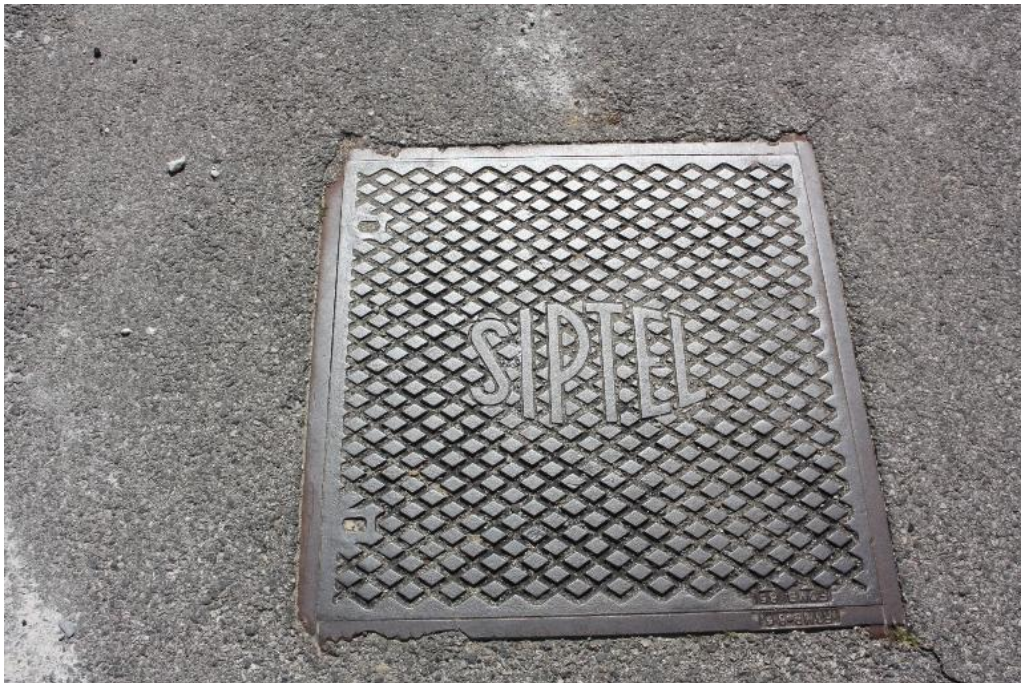
02 – Caposaldo