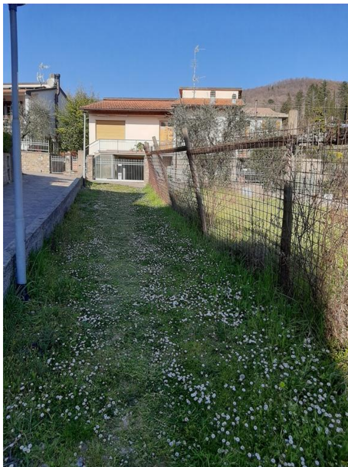
23 – Camminamento pedonale 3