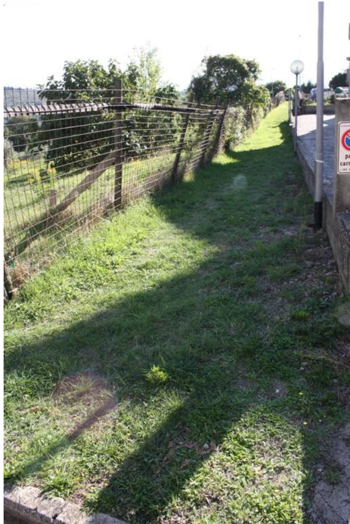
22 – Camminamento pedonale2