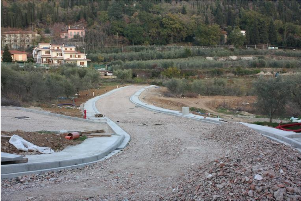
08 – strada di lottizzazione 2012