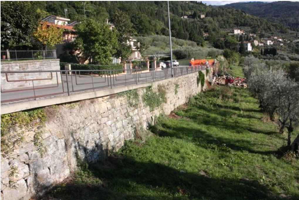
17 – Muro contenimento Via dello Stradone3